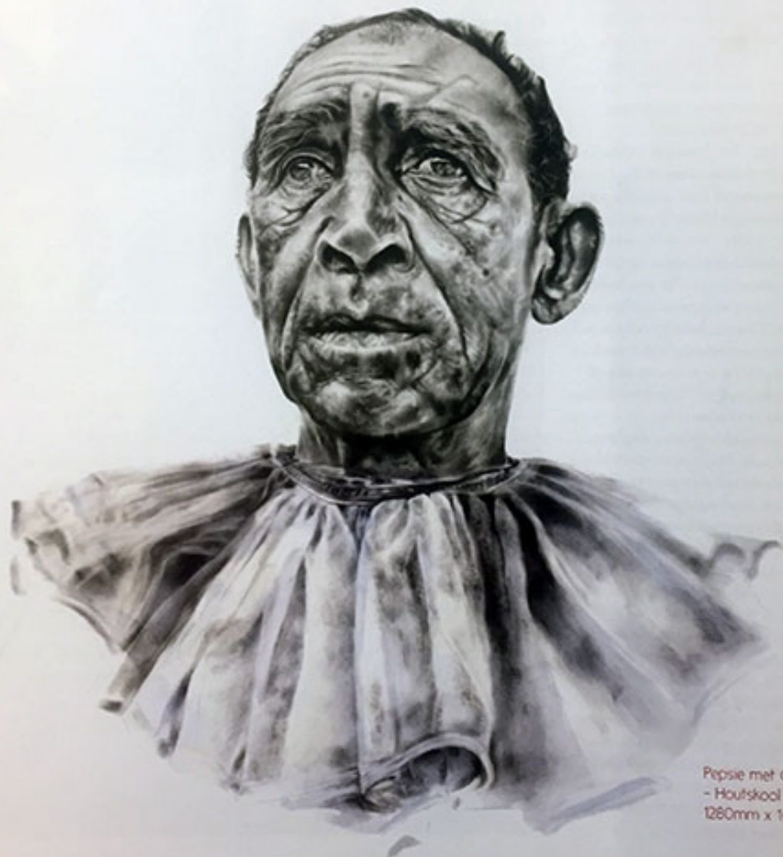
Pepsie met Clown Collar - Houtskool op papier 1260mm x 1480mm