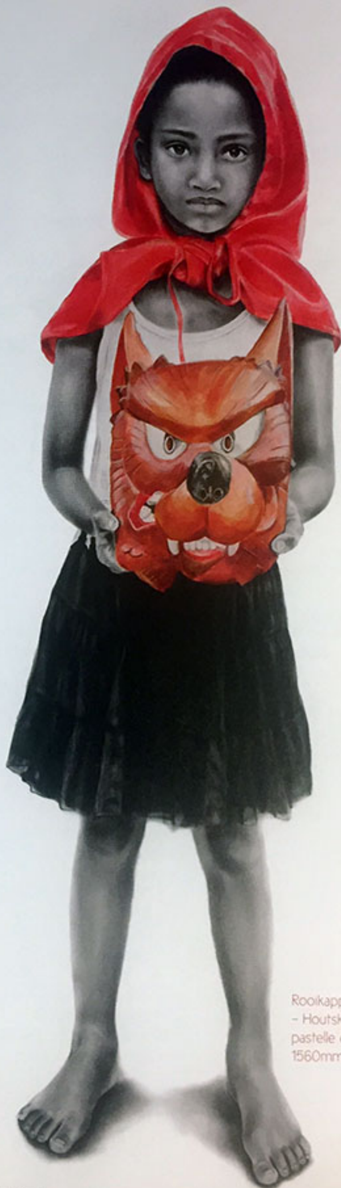
Rookkappie – Houtskool, droë pastelle en ink op papier 1560mm x 1360mm